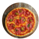
Pizza à la viande