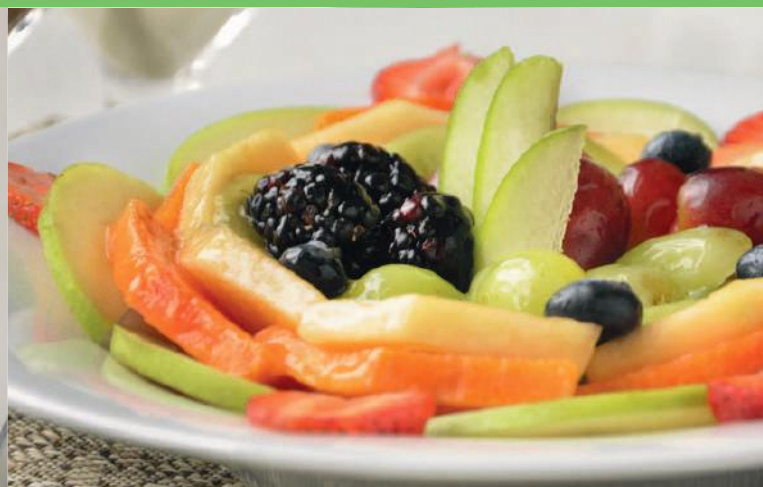
Plato con Fruta