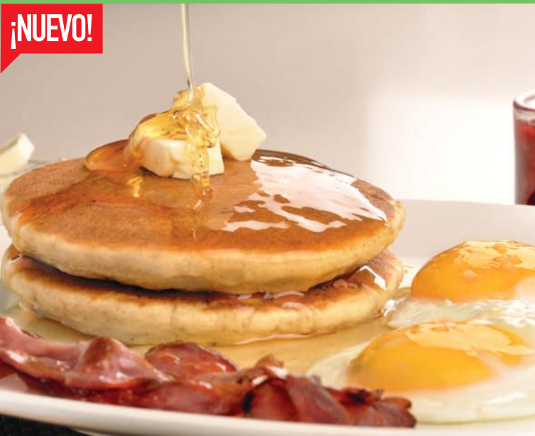
Hot Cakes Huevo y Tocino