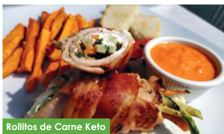
Rollitos de Carne Keto

Espectacular tortilla de almendra, con jugosa carne con queso gratinado, acompañados de rabanitos y pepino.