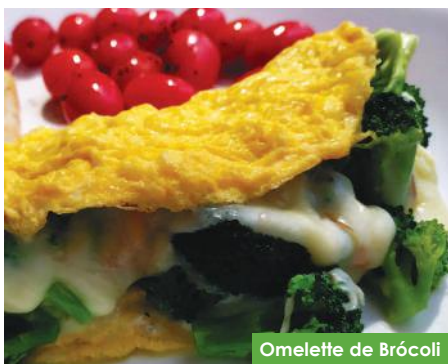
Omelette de Brócoli

Delicioso relleno de queso gratinado y brócoli, acompañado de tomates cherry y pan Keto VCh .