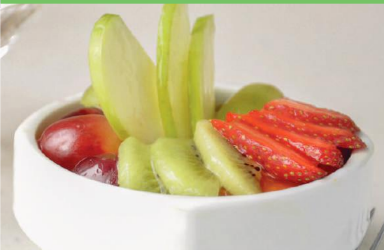
Copa de Fruta