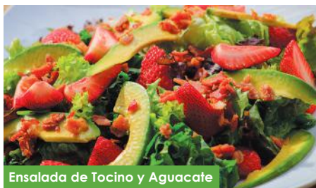
Ensalada de Tocino y Aguacate

Fresca mezcla de vegetales con un toque de vinagre de sidra de manzana y jugo de limón. Acompañado de aguacate y exquisito pan focaccia keto VCh.