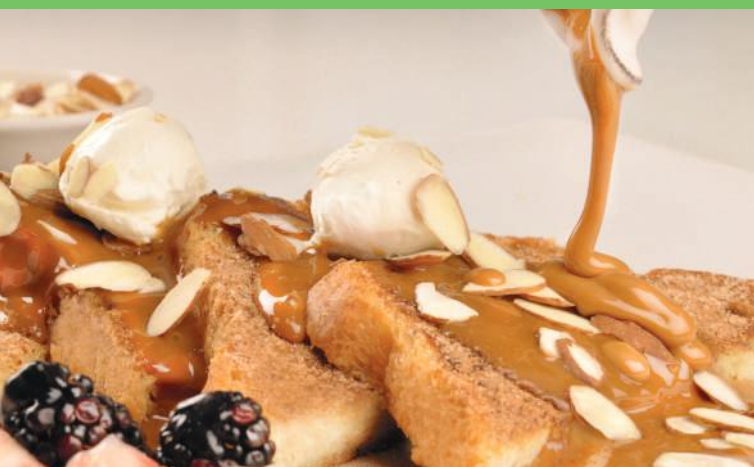
Pan Francés Dulce de Leche