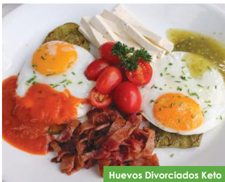
Huevos Divorciados Keto

Huevos tiernos sobre nopal, bañados en salsa verde y roja, acompañado con queso panela y crujiente tocino.