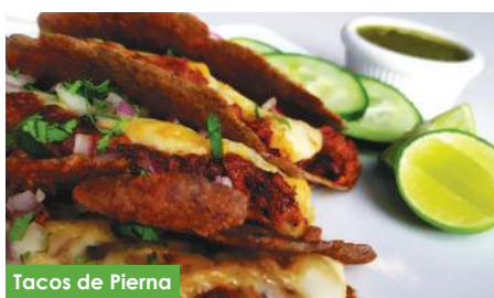
Tacos de Pierna