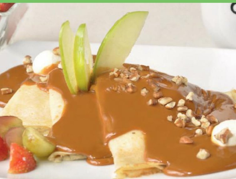
Crepas Dulce de Leche