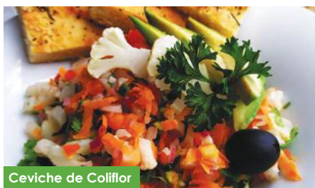
Ceviche de Coliflor