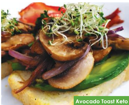
Avocado Toast Keto

Delicioso pan Keto VCh , con jamón y queso gratinado, acompañado de rebanadas de aguacate y crujiente tocino.