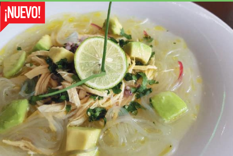
Sopa Fideo de Arroz

* Disponibilidad de fruta y verdura de acuerdo a temporada