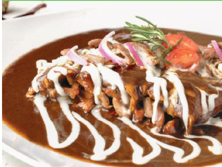
Enchiladas de Arrachera