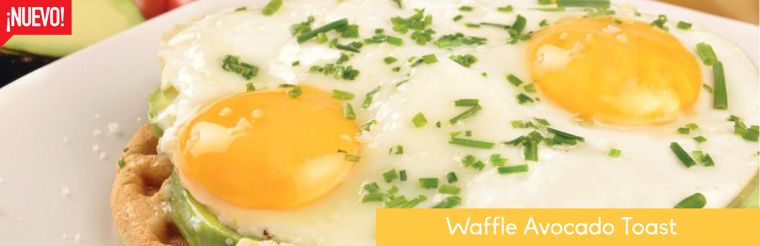
Waffle Avocado Toast