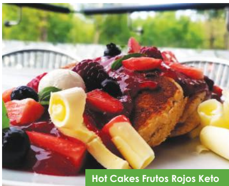
Hot Cakes Frutos Rojos Keto

Hot Cakes Gluten Free , servidos con mermelada de frutos rojos Bienestar, acompañados con fresas, zarzamoras, queso crema y mantequilla.