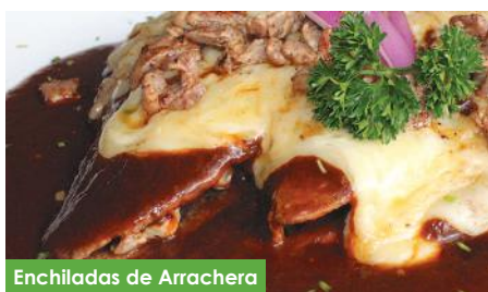
Enchiladas de Arrachera

Bistec relleno de pimiento, calabacitas, rajas y queso crema, acompañado de camote a la francesa y pan Keto VCh.