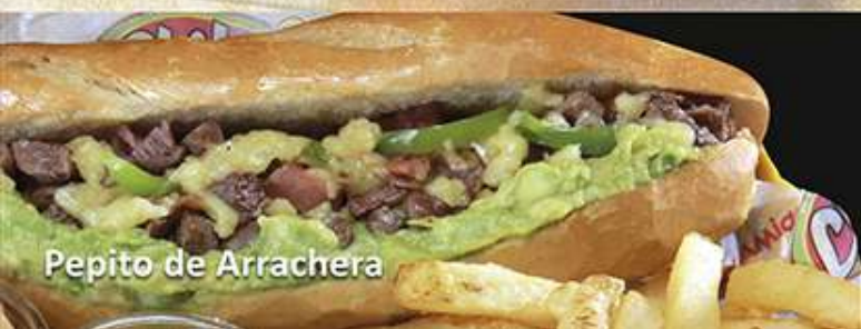
Pepito de Arrachera

Mitad top sirloin y mitad fajita de pollo. Lleva salchicha asada, cebolla, chiles toreados, 2 frijoles charros y una porción de guacamole.