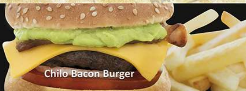
Chilo Bacon Burger