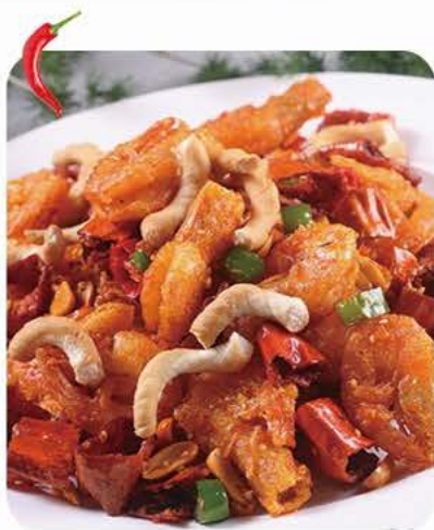
Stegt krydret rejer Fried spicy shrimp 香辣一品虾