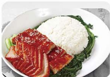
Ris med andesteg (med ben) og barbecue svinekød (charsiu) / Rice with roasted duck (with bones) and barbecue pork (Charsiu) 双拼飯 79,-