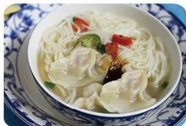
Suppe med dumpling (med kongerejer i) og nudler Soup with dumplings (with king prawns) and noodles