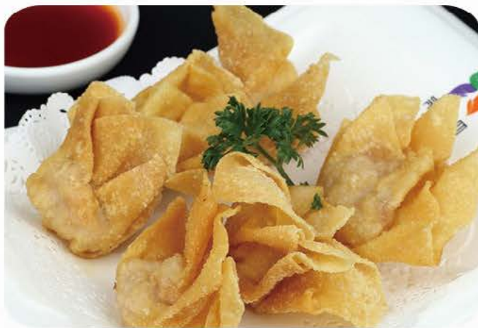
7. Dybstege wanton /Deep fried wanton