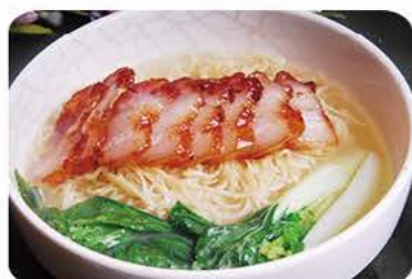
Suppe med barbecue svinekød (chasiu) og nudler Soup with barbecue pork and noodles