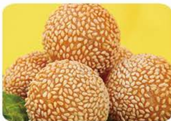
Sesamfrø kugle Sesame ball