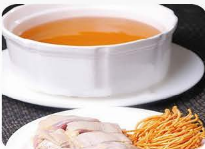
2. Hønsekød suppe/Chicken soup 鸡汤 29,-