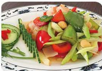
Stegt bladcelleri med rejer og macadamianødder Fried celery with shrimp and macadamia nuts