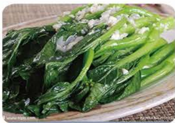
Lynstegte Choysum (kinesiske grøntsager) med hvidløg Fried Choysum with garlic