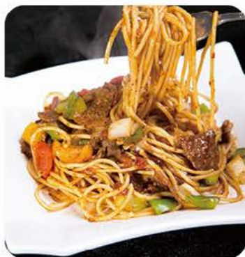
Stegte nudler med oksekød Fried noodles with beef

Vælg alm. nudler, risnudler eller brede risnudler Choose regular noodles, ricenoodles or wide ricenoodles