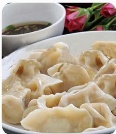
5. Kinesiske dumplings