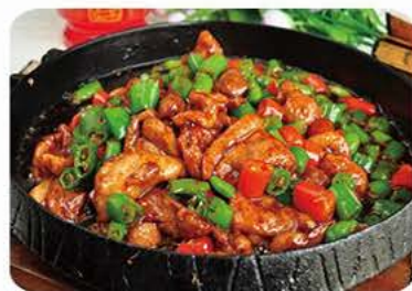
Andstege med grøntsager på jernfad Duck with vegetables on iron plate 铁板鴨 86,-