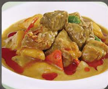
Oksekød i karry sauce Beef with curry sauce