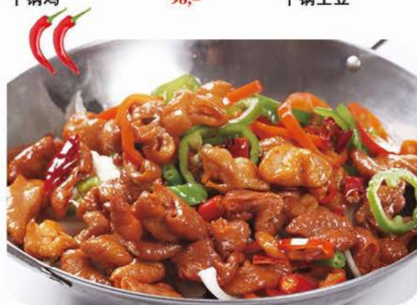
Stegte svinetarmen med grøntsager i jerngryde Fried pork intestines with vegetables in iron pot 干锅香辣肥肠 138,-