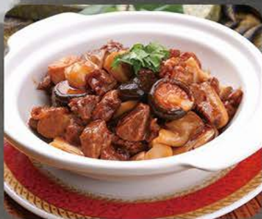
Braiseret oksekød i lergrøde Braised beef in clay pot