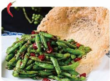
Tørstegte grønne bønner med tør chili og hvidløg Dryfried green beans with dry chili and garlic