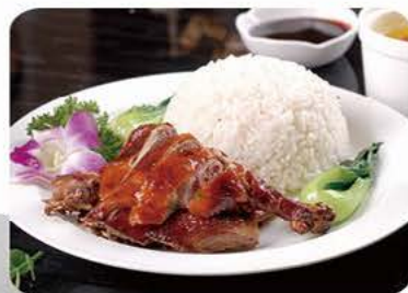
Ris med andesteg (med ben) Rice with roasted duck (with bones) 烧鴨飯 73,-