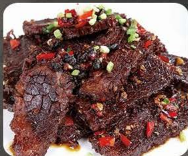
Oksekød i sort bønne sauce Beef with black bean sauce