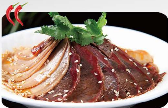
Oksemave, oksekød og oksehjerte i chilisovs Beef stomach, beef and beef heart in chili sauce