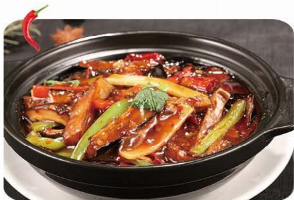
Krydrede auberginer med hakket svinekød i lergryde Eggplants with minced pork in clay pot