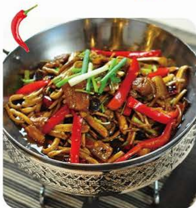
Stegte kinesiske tørret svampe med svinekød på jerngryde Fried dried chinese mushroom with pork on iron pot