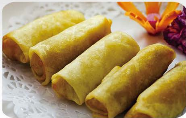
Forårsrulle med and /Spring roll with duck