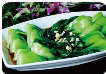
Lynstegte pachoi med hvidløg Fried pachoi with garlic