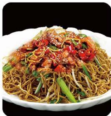
Stegte nudler med kylling Fried noodles with chicken