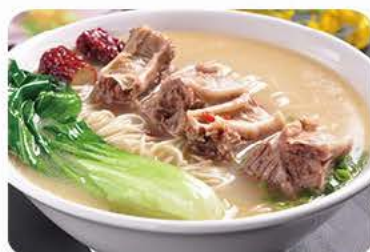
Suppe med braseret oksekød og nudler Soup with braised beef and noodles