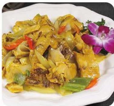
Kylling i karry sauce med grøntsager Chicken with curry sauce with vegetables