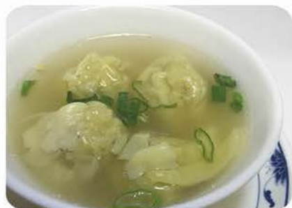
3. Wanton suppe/Wanton soup 云吞汤 lille/small/小碗 35,- stor/large/大碗 63,-