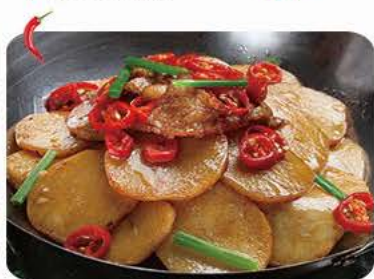
Stegte kartofler med grøntsager i jerngryde Fried potatoes with vegetables in iron pot 干锅土豆 67,-