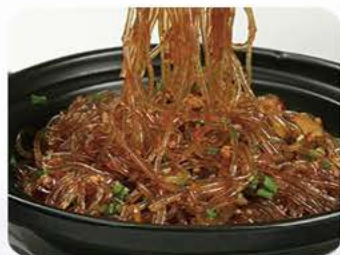
Stegt hakket svinekød med klar nudler Fried minced pork with clear noodles