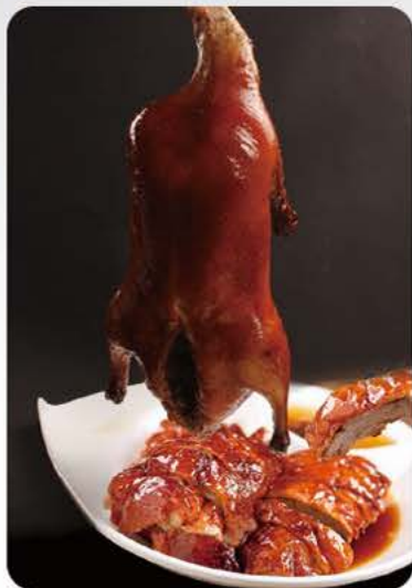
Andesteg a la Hongkong (med ben) Roasted duck Hongkong style (with bones) 香港鴨(半只) 86,-