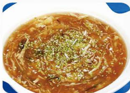
1. Peking suppe/Peking soup 北京汤 33,-