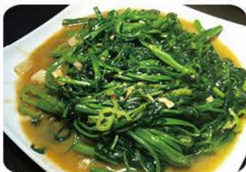
Stegte kinesisk vandspinat i rødtofu sauce Fried chinese water spinach with redbean tofu sauce