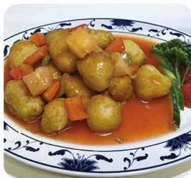
Indbagt kylling med sursød sauce Crispy chicken with sweet and sour sauce