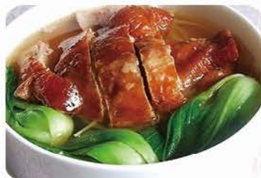
Suppe med andesteg (med ben) og nudler Soup with roasted duck (with bones) and noodles