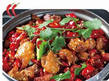
Stegte kylling med grøntsager i jerngryde Fried chicken with vegetables in iron pot 干锅鸡 98,-