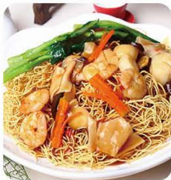
Stegte nudler med seafood Fried noodles with seafood