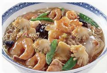
Suppe med seafood og nudler Soup with seafood and noodles