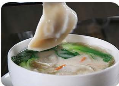
4. Dumpling suppe (med kongerejer i) Dumplings soup (with king prawns) 凤城水饺汤 lille/small/小 38,- Stor/large/大 65,-