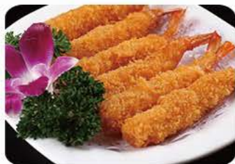
Dybstegt kongerejer Deep fried king prawns