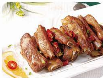
Sprøde Spareribs med krydret salt Crispy spareribs with spiced salt