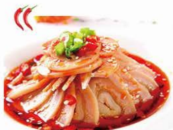
Oksemave i chilisovs Beef stomach in chilisaucе