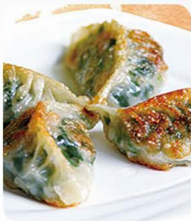
6. Pandestegt dumplings