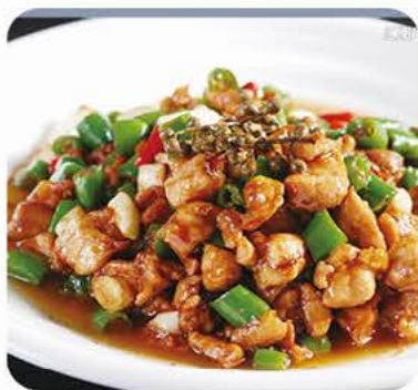
Kylling i skiver med huikou sauce (lidt sød) Sliced chicken with huikou sauce (little sweet)