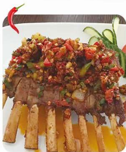
Grillet lammekotletter Grilled lamp chops 手抓羊排