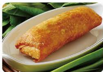
Stor forårsrulle Big spring roll