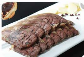
Krydret oksemuskel med chilisaucе Spiced beef muscle with chilisaucе