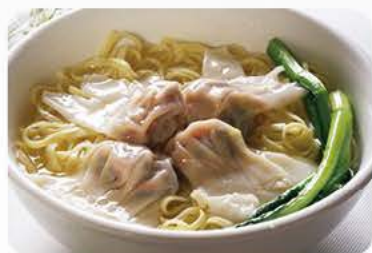
Suppe med wanton og nudler Soup with wanton and noodles