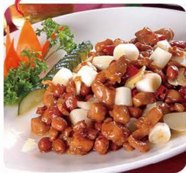
Kylling med gongbao sauce (sød og stærk) Chicken with gongbao sauce (sweet and spicy)