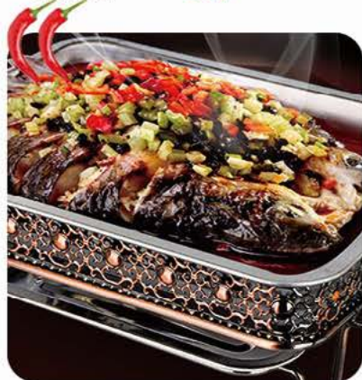
Sichuan grillet fisk Sichuan grilled fish 农夫烤鱼