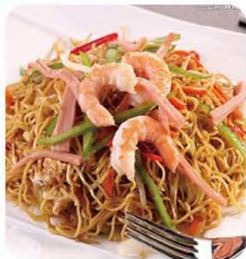
Stegte nudler med kongerejer Fried noodles with king prawns