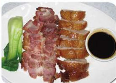
Andesteg (med ben) og barbecue svinekød (charsiu) Roasted duck (with bones) and barbecue pork (charsiu) 招牌双拼 99,-