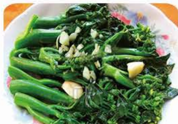
Lynstegte gailan med hvidløg Fired gailan with garlic