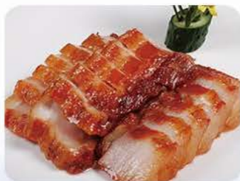
Barbecue svinekød (Charsiu) Barbecue pork (Charsiu)