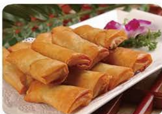
Små forårsruller Small spring rolls