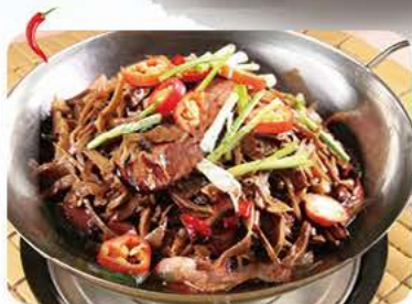
Stegte tørret bambus med svinekød i jerngryde Fried dried bamboo with pork in iron pot 干锅笋干焖肉 128,-