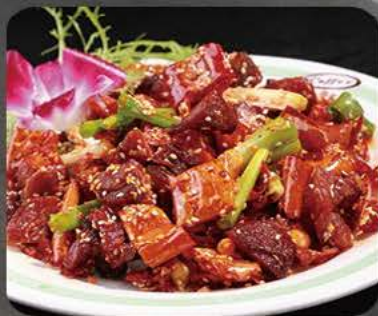
Oksekød med sursød sauce Beef with sweet and sour sauce