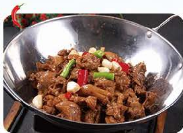
Stegte andekød med grøntsager i jerngryde Fried duck with vegetables in iron pot 干锅去骨鸭 96,-