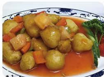
Indbagt svinekød med sursød sauce Crispy pork with sweet and sour sauce