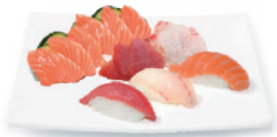
M18B 17,80€ 12 Pièces de sashimi, 3 Pièces de sushi