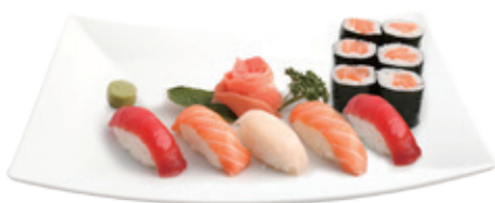
M16B 15,80€ 5 sushi, 6 maki (2 sushi saumon, 2 sushi thon, 1 sushi daurade, 6 maki saumon)