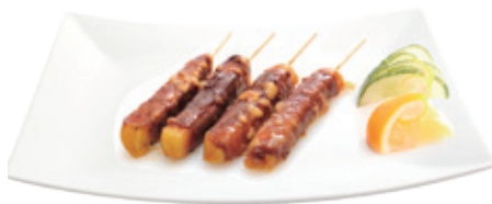
M34 9,80€ 4 Brochettes (boeuf au fromage)