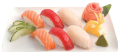
M16 14,80€ 6 Pièces sushi (saumon, thon, daurade)