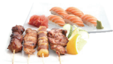
M22B 16,80€ 5 Sushi saumon, 4 Brochettes (1 poulet, 1 bœuf fromage, 1 aile de poulet, 1 boulette de poulet)