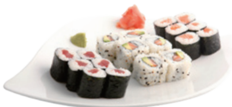
M15 15,80€ 18 Pièces maki (6 saumon, 6 thon, 6 california)

Tous les menus sont accompagnés avec soupe, salade et riz