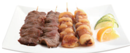
M34B 12,80€ 4 Brochettes (2 boeuf au fromage, 2 boeuf nature)

Pour tout changement : un supplément de 2 €