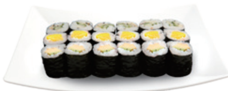
M15B 14,80€ Maki végétarien (6 maki concombre, 6 maki radis, 6 maki avocat)