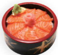
M11 SHAKEDON 12,80€