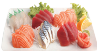
M17 18,80€ Menu grand sashimi (20 pièces)