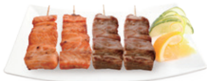
M30 14,80€ 4 Brochettes (2 brochettes de saumon, 2 brochettes de thon)

Tous les menus sont accompagnés avec soupe, salade et riz