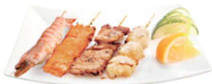
M31 14,80€ 4 Brochettes (1 gambas, 1 noix de st jacques, 1 saumon, 1 thon)