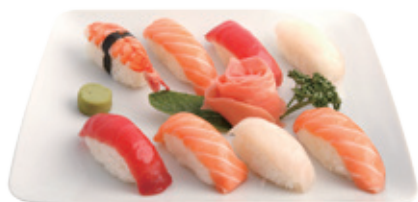
M18 17,80€ 8 Pièces sushi (crevette, saumon, thon, daurade)

Pour tout changement : un supplément de 2 €