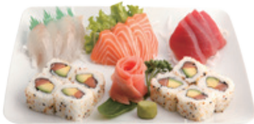
M20 17,80€ 12 Pièces de sashimi, 6 Pièces californie