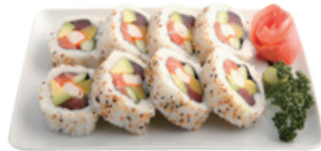
M21 16,80€ 8 Pièces de futomaki