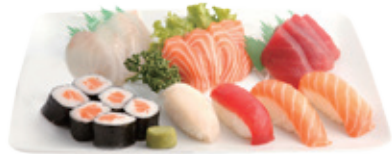
M19 24,80€ 15 Pièces de sashimi, 4 pièces sushi, 6 pièces maki