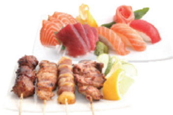
M22 17,80€ 6 Pièces sashimi, 3 pièces sushi, 4 Yakitori (poulet, bœuf au fromage, aile de poulet et boulette de poulet)

Tous les menus sont accompagnés avec soupe, salade et riz