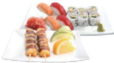
M22C 17,80€ 6 californie thon cuit, 4 sushi, 2 brochettes (bœuf fromage)