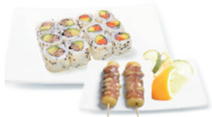
M22D 16,80€ 6 California saumon avocat, 6 California thon cuit, 2 Yakitori (bœuf au fromage)

Pour tout changement : un supplément de 2 €