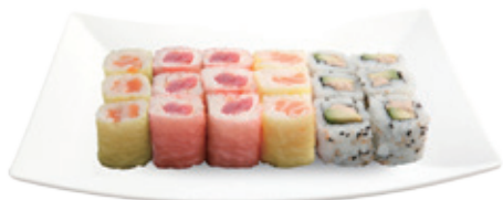
M15C 16,80€ 18 pièces de maki 6 California avocat thon cuit, 12 maki feuille de soja (thon, saumon)