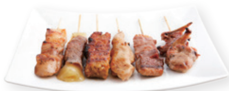
M33 14,80€ 6 Brochettes (Assortiments de brochettes de viandes)