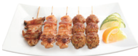
M32 12,80€ 5 Brochettes (2 poulet ,2 boulettes de poulet, 1 aile de poulet)