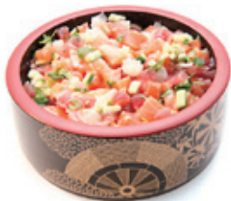
M13B 16,90€ Chirashi mariné

saumon, thon, concombre, avocat, sauce citronnée, sur un bol de riz vinaigré