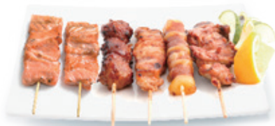
M30B 16,80€ 6 Yakitori (2 brochettes de saumon, 4 brochette de viande)