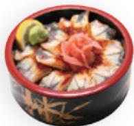
M12 UNAGIDON 16,80€

Un bol de riz vinaigré avec d'anguille cuite