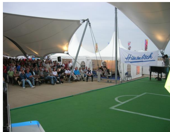
WM 2006 Public Viewing Brüggmanngarten Lübeck - Travemünde Strandpromenade