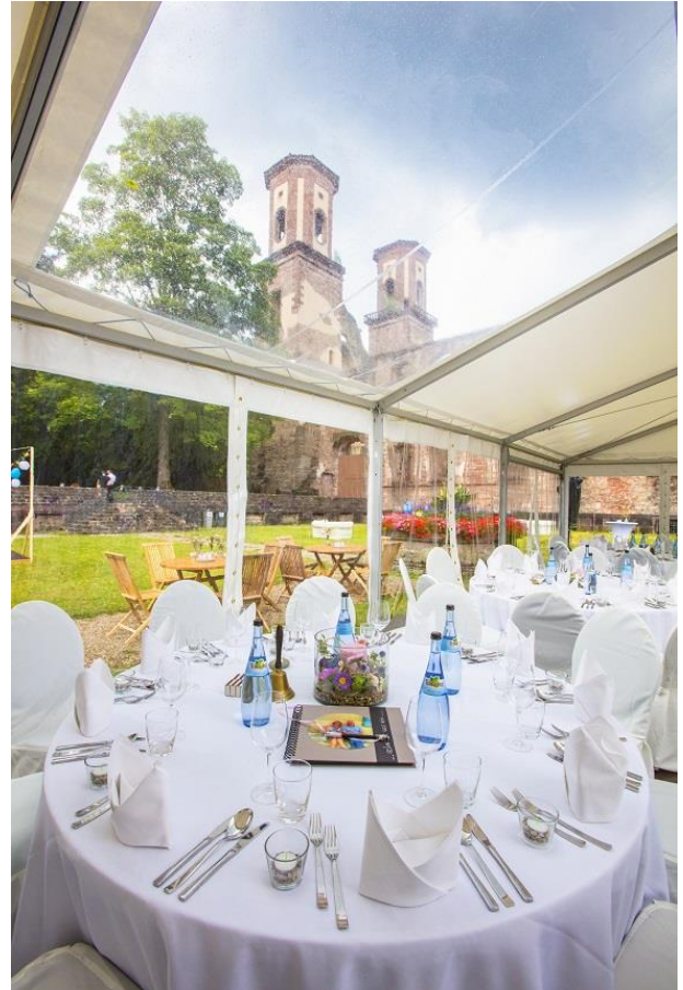
Rundtische mit bodenlangen Tischdecken