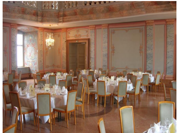
Hochzeit in edler Atmosphäre

Sprechen Sie uns auf Tagungspauschalen an