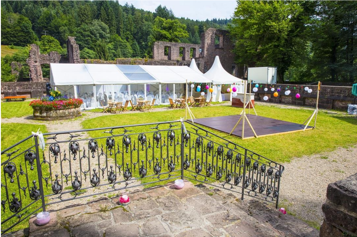
Festzelt 10 x 15m und Pagodenzelte 5 x 5m in der Klosterruine Frauenalb